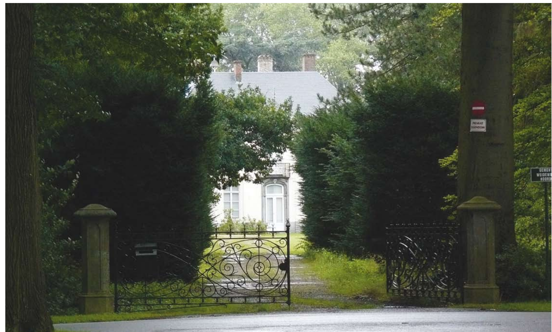
Voorraanzicht kasteel van Rooigem gelegen nabij de bisschopdreef te St-Kruis. Van de eens zo geroemde tuin van de Brugse bisschoppen schiet bitter weinig over, het geheel ziet er niet onderhouden en zelfs verwaarloosd uit.