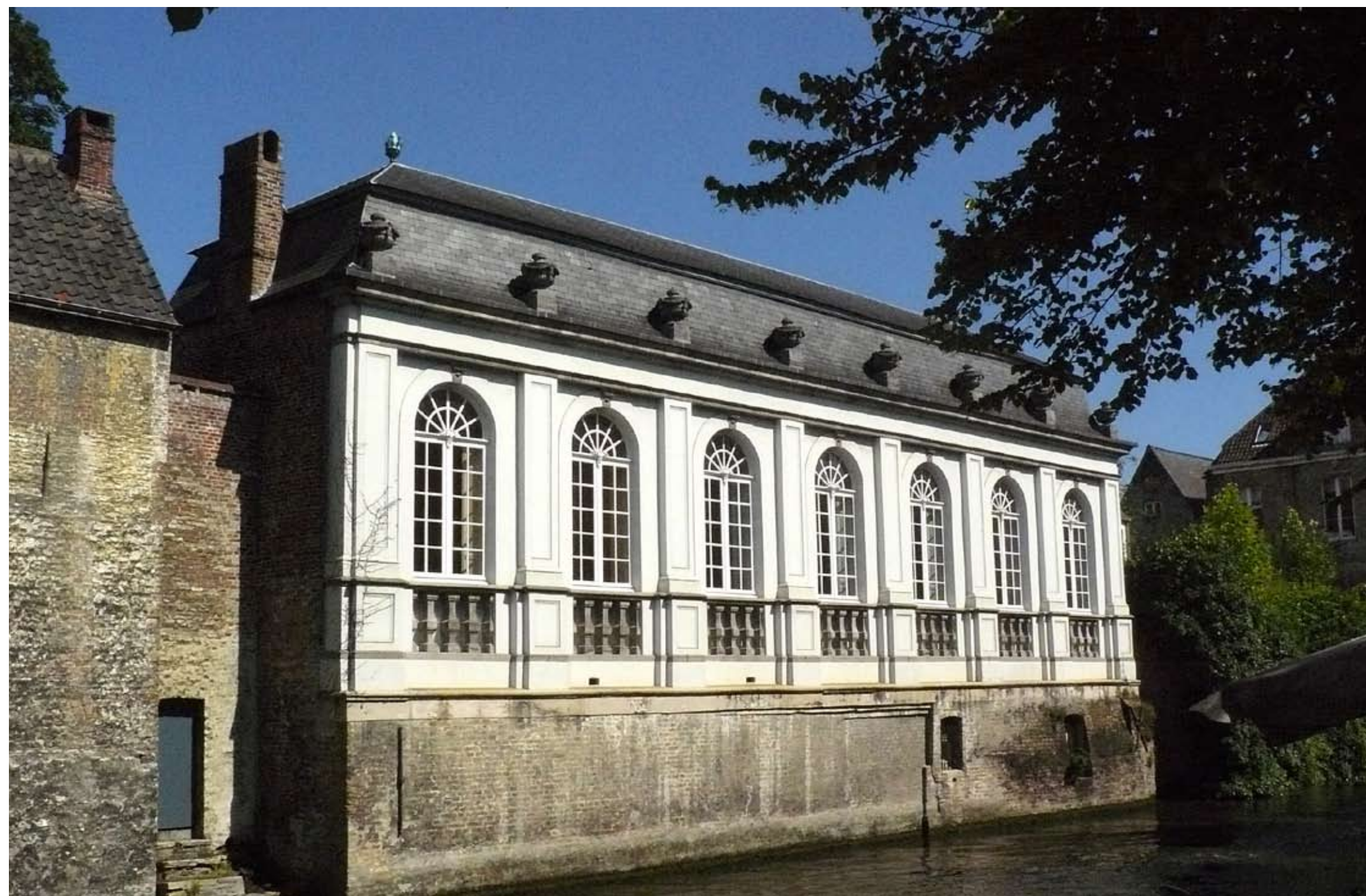
Orangerie van het huis de Halleux of zoals het vandaag (ten onrechte) genoemd wordt het hof Lanchals . Het prachtige studecor binnenin zou er kunnen op wijzen dat de ruimte meer gebruikt werd om te feesten dan om orangerieplanten in onder te brengen. Ook heden ten dage wordt deze prachtige zaal vaak voor feestelijkheden of culturele activiteiten benut .